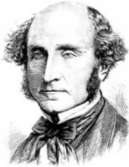
John Stuart Mill (1806-1873): ‘ask yourself whether you are happy, and you cease to be so’.

our own good in our own way, so long as we do not attempt to deprive others of theirs, or impede their efforts to obtain it. 7 In zijn autobiografie, het laatste werk dat nog bij zijn leven verscheen, merkt Mill op dat het nastreven van geluk als levensdoel makkelijk op een teleurstelling kan uitlopen en het verstandiger is om geluk als afgeleide van andere doelen te beschouwen: ‘ask yourself whether you are happy, and you cease to be so. The only chance is to treat, not happiness, but some end external to it, as the purpose of life.’ 8