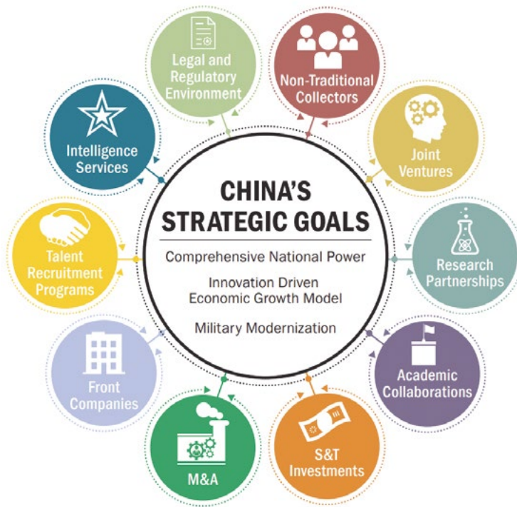
Deze figuur laat zien welke middelen China inzet om zijn strategische doeleinden te realiseren. Naast reguliere activiteiten zoals aangaan van joint ventures schuwt China niet om ook zijn inlichtingendiensten in te zetten of 'insiders' te rekruteren | bron: Amerikaanse Cybersecurity & Infrastructure Security Agency.

ondermijnt marktprikkels om tot duurzame (structurele) innovatie te komen. De randvoorwaarden voor deze marktprikkels zijn er simpelweg niet in een communistisch systeem: er is geen bescherming van individueel eigendom en er is geen eerlijke handel tussen individuen mogelijk. Niemand krijgt een prikkel om tot nieuwe, innovatieve handel te komen. Hierdoor ontbreekt een mate van complexiteit zoals in liberale Westerse economieën waarin in principe een ieder kan toetreden tot markten en zal worden beloond, indien hij of zij een goed product aanbiedt. Hierdoor ontstaan nieuwe ontwikkelingen, groot en klein, die tezamen een innovatie-