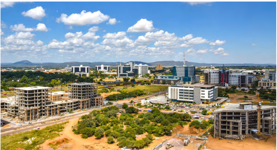
Ontwikkeling van het internationale zakencentrum in Gaborone, Botswana

De auteurs menen dat de overgang van extractieve naar inclusieve instituties een erg moeizaam, langzaam, en bovenal toevallig proces is. Zij zijn dan ook sceptisch over revoluties in landen met extractieve instituties, die meer vrijheden en welvaart voor het volk beloven. Vaak komen revoluties namelijk neer op een nieuwe elite die de oude elite vervangt. Dit wordt ook wel de ‘ijzeren wet van oligarchie’ genoemd. De communistische revolutie in de Sovjet-Unie is hier een voorbeeld van. Na het einde van het tsaarbewind bleef de macht alsnog in handen van een kleine elite, ondanks beloftes van