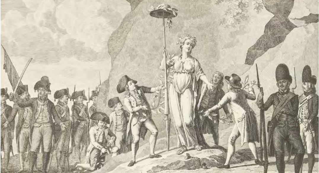
Soldaten versieren beeld van vrouw met lans en vrijheidshoed met guirlanden van laurier (1796) prent naar tekening van Jan Arends | Wikimedia Commons